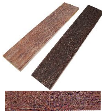
Cerrato Madeira Nobre